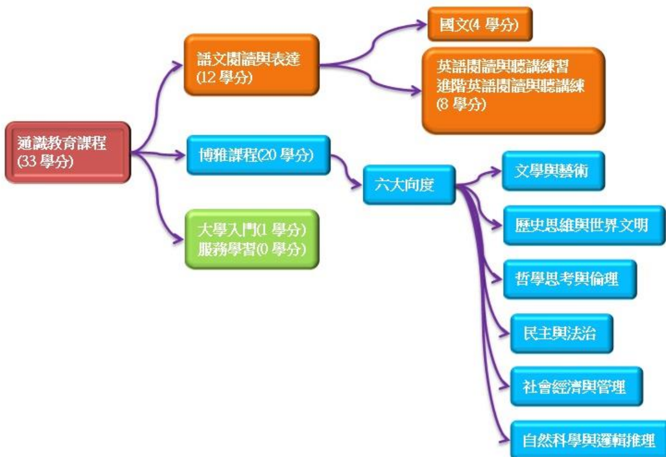
各學院規定必選五向度表